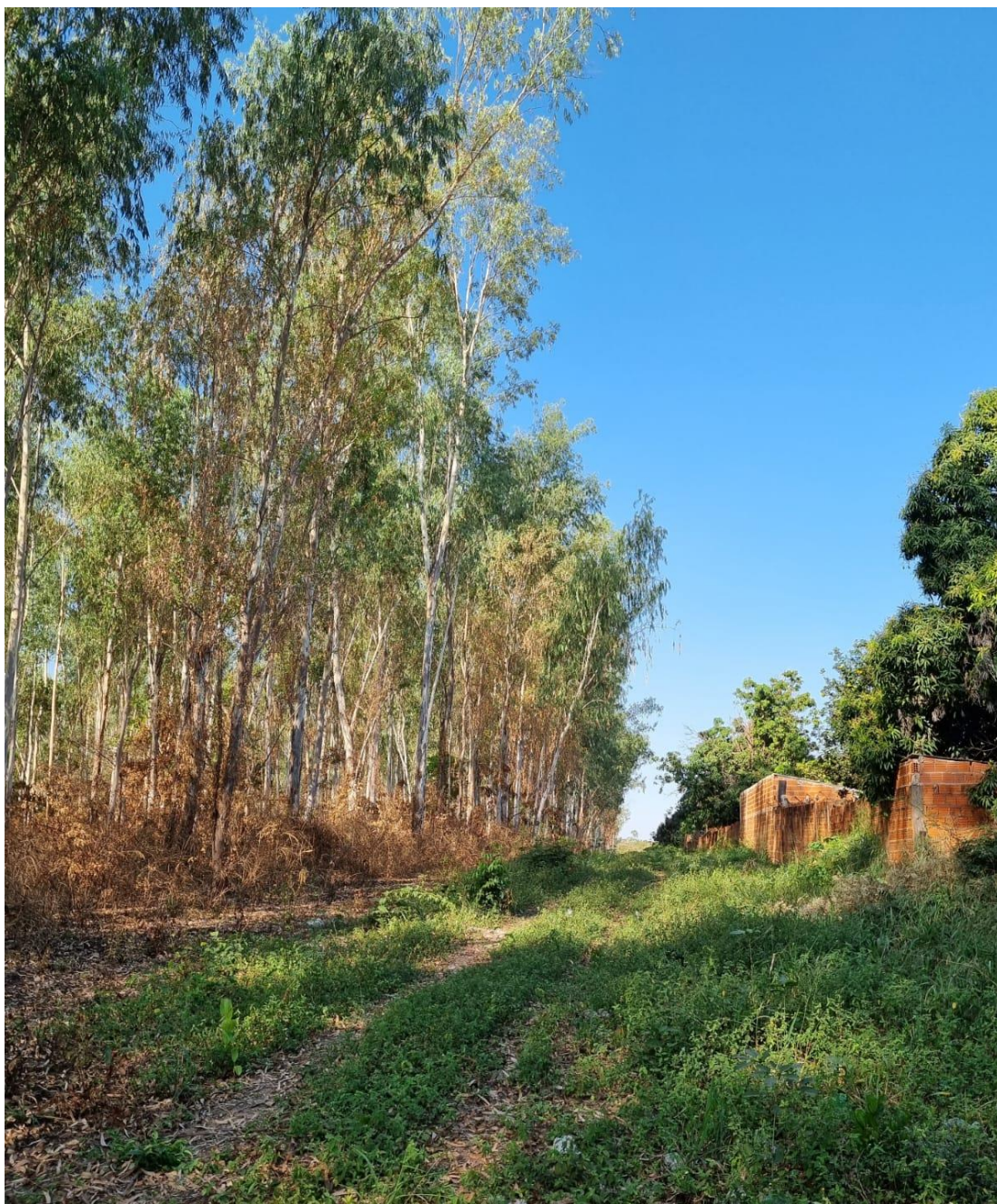
LATERAL DA ÁREA/LIMITE COM RESIDÊNCIAS DO BAIRRO