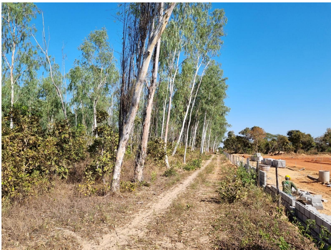
FUNDOS DA ÁREA/CONSTRUÇÃO DE CONDOMÍNIO DE CASAS NO LIMITE