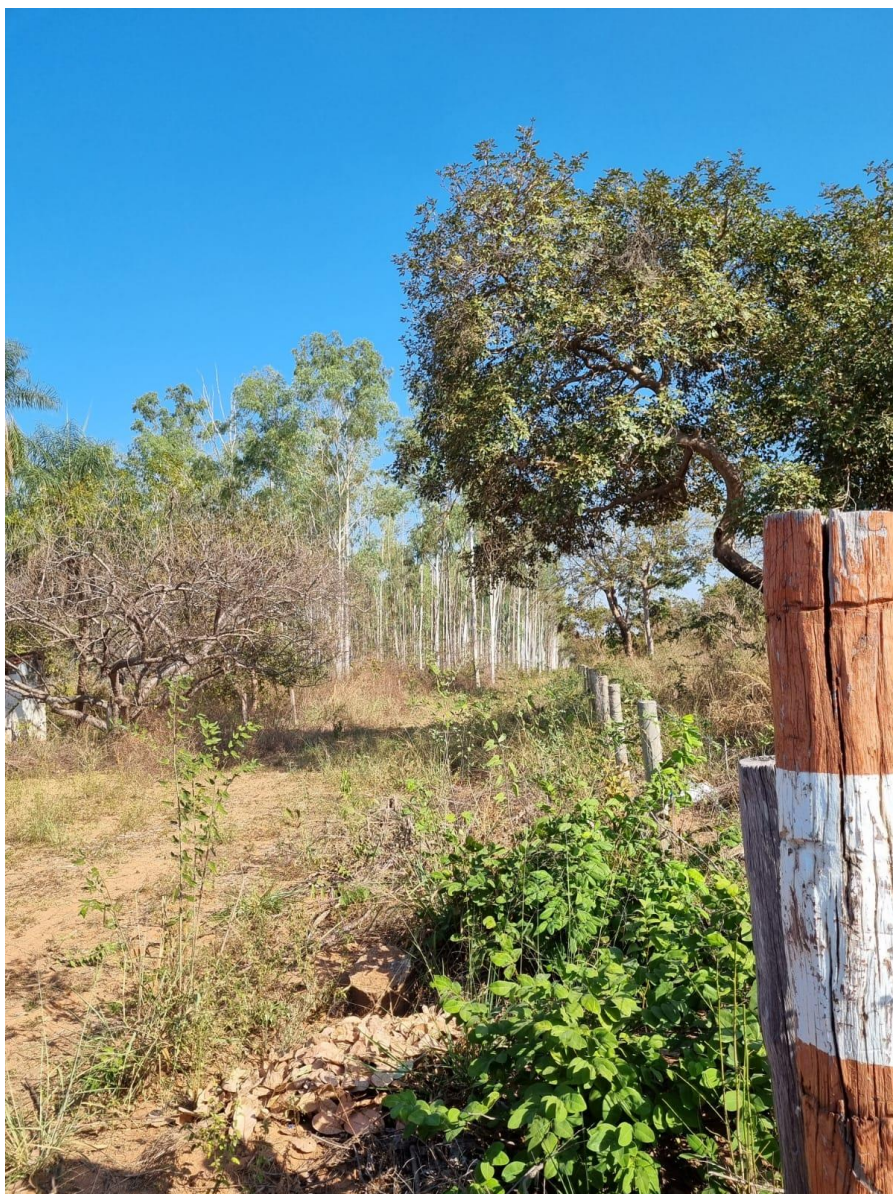
ENTRADA DOS FUNDOS (LOCALIZADOR GOOGLE MAPS PLUS CODE: 8WV9+WQM Várzea Grande, MT)