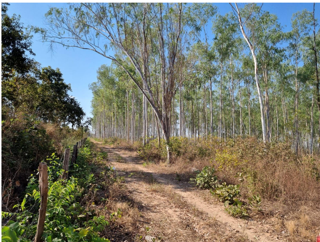
FUNDOS DA ÁREA/PLANTAÇÃO DE EUCALIPTO