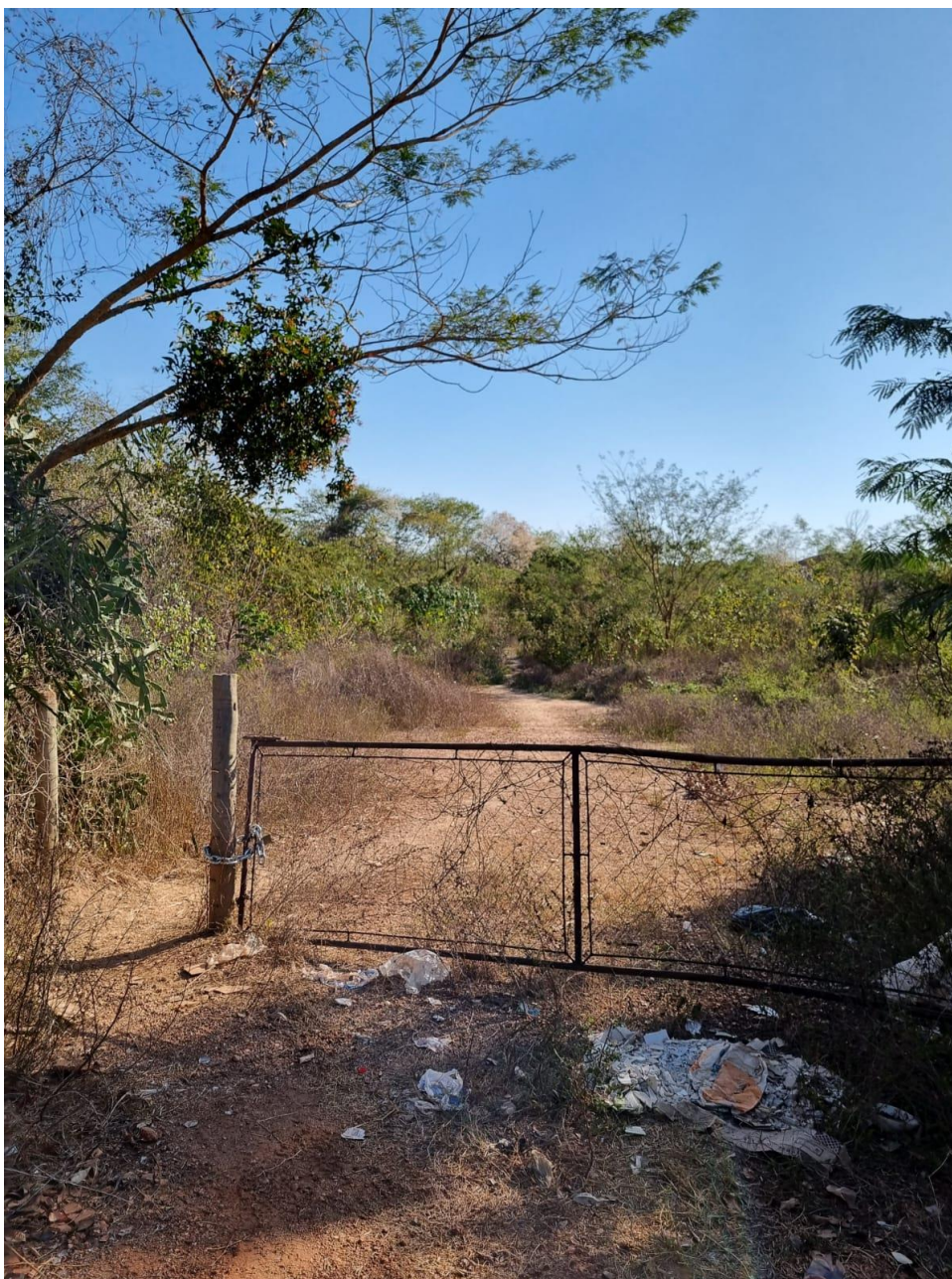
PORTÃO DA FRENTE DA ÁREA P AV. JÚLIO MULLER (LOCALIZADOR GOOGLE MAPS PLUS CODE: 8WRH+M4V Porto Velho, Várzea Grande – MT)