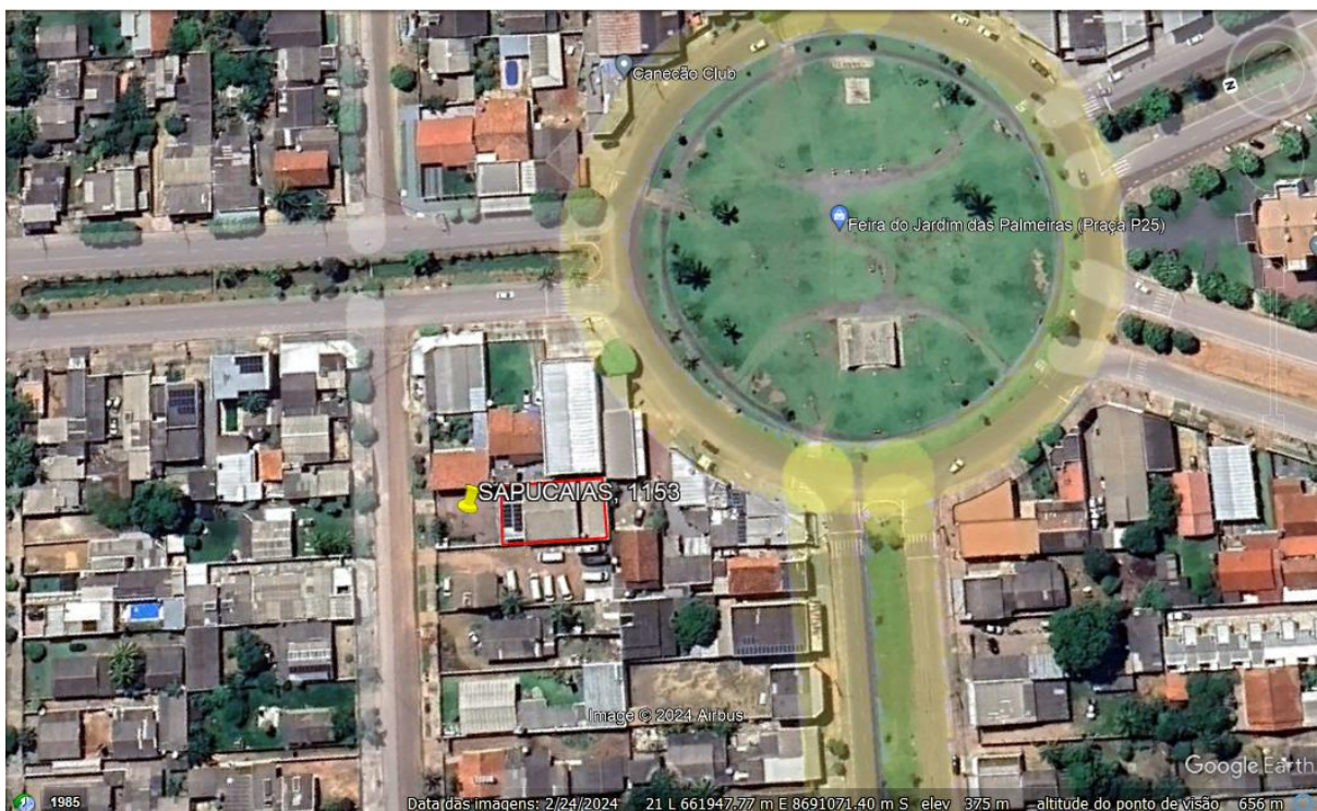
Imagem do Google Earth : Destaque em vermelho para a área construída.

Piso cerâmico de baixa qualidade em alguns cômodos e de média a alta qualidade em outros, forro parcial em PVC e parcial em gesso, e cobertura parcial em telha termoacústica e parcial em fibrocimento.